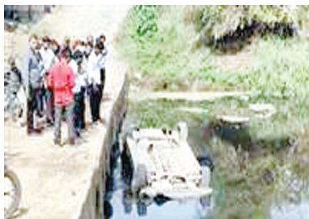
त्रिपुरी टाइम्स • जबलपुर www.tripurimes.com

बेलखाडू-पनागर मार्ग पर तेज गति से भाग रही एक कार ग्राम बघोड़ा के पास परियट नदी के पुल से नीचे गिर गई। दुर्घटनाग्रस्त कार नदी के पानी में आधी डूब गई। कार में तीन लोग सवार थे। सभी सुरक्षित बाहर निकाल लिए गए हैं। प्रत्यक्षदर्शियों के अनुसार पाटन के करारी ग्राम निवासी तीन व्यक्ति एक कार एमपी 20 जेडबी 7089 में सवार होकर पनागर गए थे। अपना काम करने के बाद कार सवार तीनों व्यक्ति बेलखाडू वापस लौट रहे थे। उनकी कार दोपहर को लगभग साढ़े तीन बजे ग्राम बघोड़ा के पास पहुंची। इस स्थान पर परियट नदी से पहले चढ़ाई है। चढ़ाई की जगह पर कार तेज गति से चल रही थी। इस दौरान अचानक कार चालक ने वाहन पर नियंत्रण खो दिया। अनियंत्रित कार लहराते हुए परियट नदी के पुल से नीचे गिर