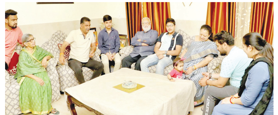
त्रिपुरी टाइम्स • जबलपुर www.tripuritimes.com

विसर्जन शोभायात्रा निकाली जाएगी। इसके लिए जिला एवं पुलिस प्रशासन के अधिकारियों से चर्चा कर व्यवस्था बनाई गई है ' शोभायात्रा मंदिर परिसर से प्रारंभ होकर दीनानाथ क्रासिंग , राजा रसगुल्ला की गली , मिलोनीगंज चौक से घोड़ा नक्कास होते हुए हनुमानताल पहुंचेगी जहाँ थाने के सामने घाट पर विसर्जन किया जाएगा। मंदिर ट्रस्ट पदाधिकारियों ने सभी श्रद्धालु भक्तों से उपस्थिति की अपील की है।