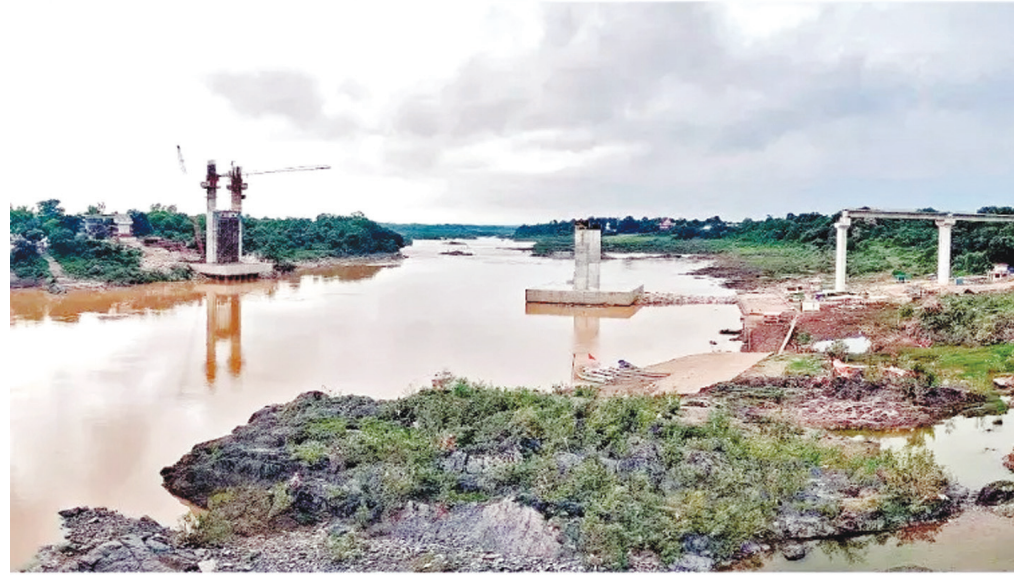
त्रिपुरी टाइम्स • जबलपुर www.tripurimes.com

लम्हेटा केबल स्टे ब्रिज की निर्माण लागत को दो माह पहले 89 से 177 करोड़ कर दिया, पर इसके निर्माण की गति को अब तक नहीं बढ़ाया जा सका है। लोक निर्माण सेतु सितंबर 2024 में इसका निर्माण पूरा होने का दावा कर रहा था, अब यह मार्च 2025 में पूरा होगा, यह कहा जा रहा है। नर्मदा के ऊपर बन रहे इस केबल स्टे ब्रिज के निर्माण का