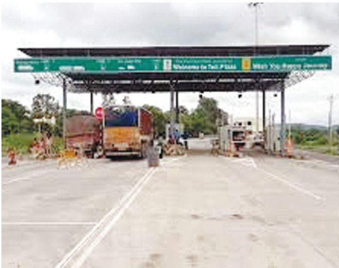
त्रिपुरी टाइम्स • जबलपुर www.tripuritimes.com

तीन सालों से परिवहन नियमों को दरकिनार लोगों से वसूला जा रहा टोल